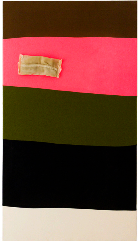
Snusmålning II, 2020, 110 x 60 cm, textilapplikation