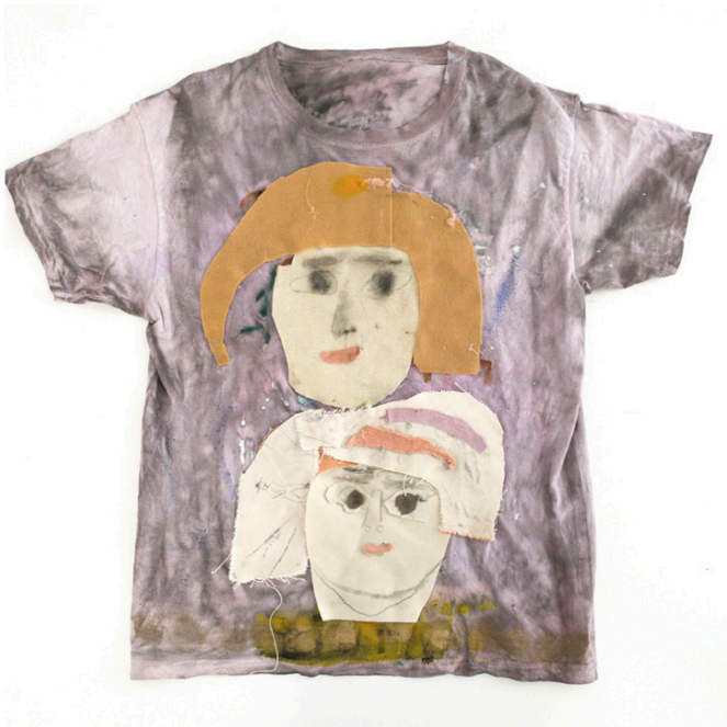
Bröderna, 2020, 66 x 75 cm, ur kollektionen Japanese Disco Boy