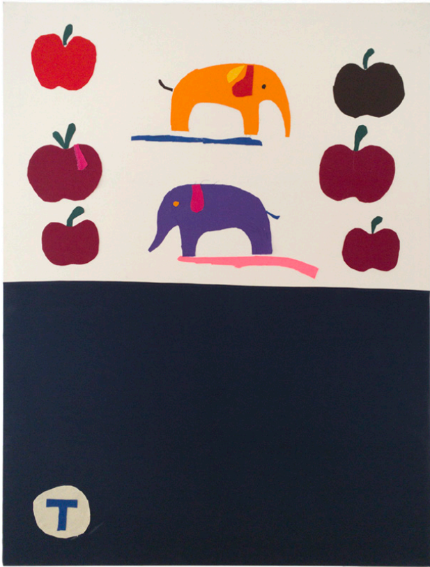
Blå och röda linjen, 2020, 200 x 150 cm, textilapplikation