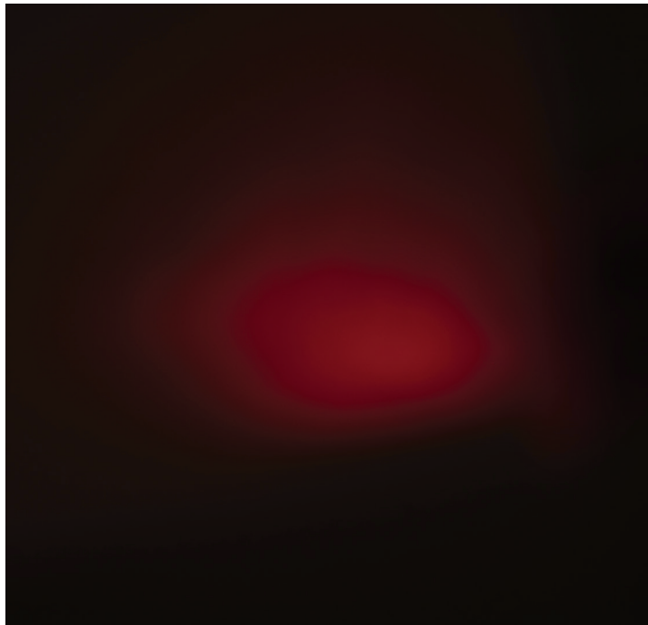
determined and aligned, 2021, 30 x 30 cm, inkjet, fine art paper, Ed 1/2