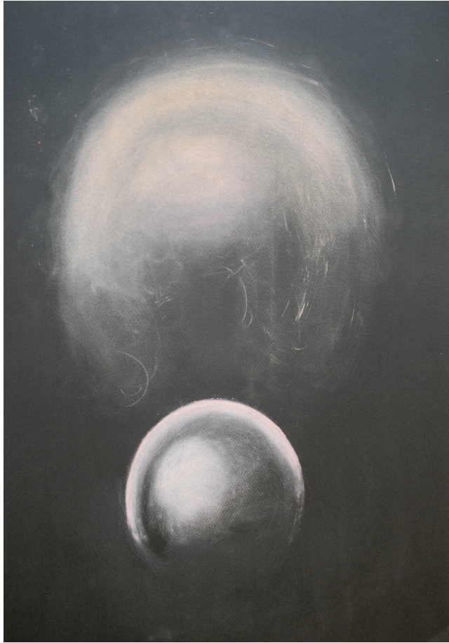
REMERGENCE I, 2021, 42 x 30 cm, torrpastell på papper