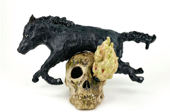
Cheating death, 2021, 17 x 32 x 15 cm, keramik