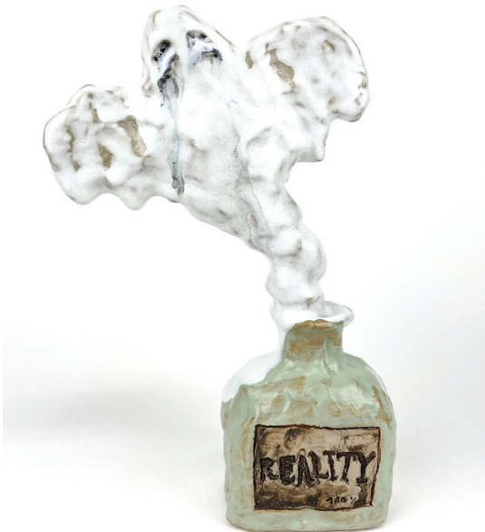
100% reality, 2021, 29 x 17 x 8 cm, keramik