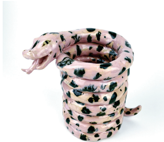
Little desire rosa , 2021, 19 x 22 x 14 cm, keramik