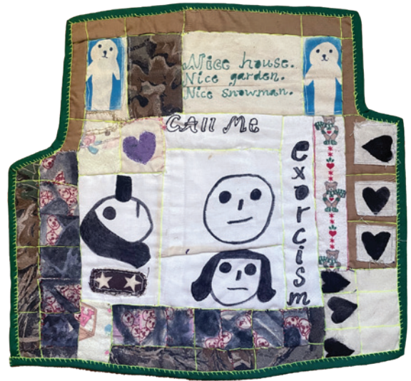
Det blir väl kbt istället för..., 2022 37 x 38 cm, textil, tusch