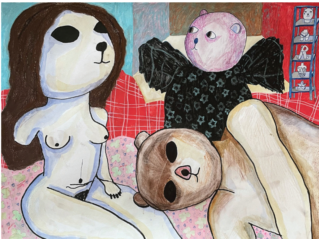
Svartsjukans ängel, 2021, 42 x 59 cm, torrpastell, tusch, akvarell på papper