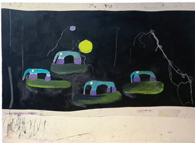
Björn Kjelltoft Oroliga promenader, 2023, 85 x 145 cm, olja på duk m applikation