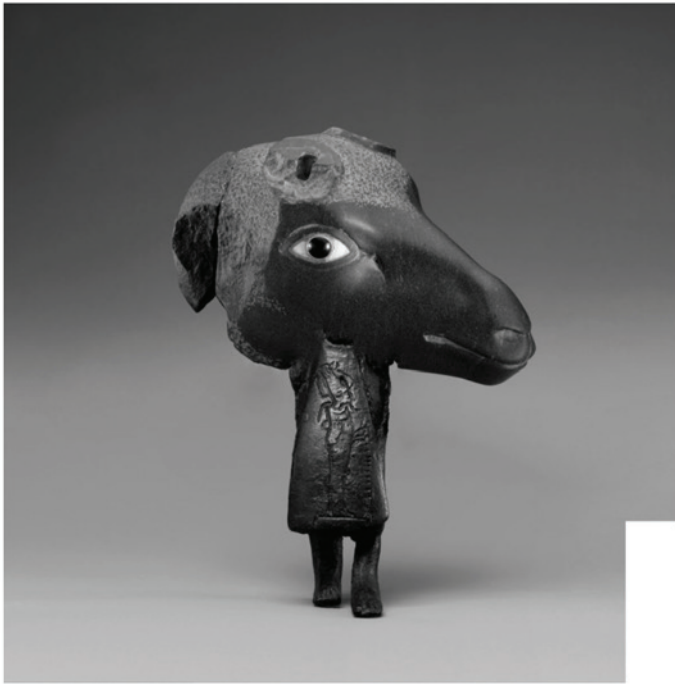
Erik Berglin Iconoclashes #24, 2014, 92 x 110 cm, Giclee på papper