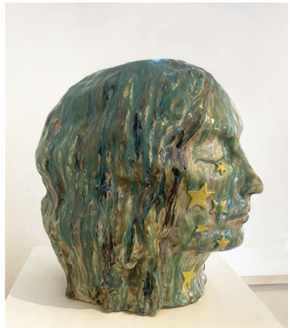
Sara Gewalt Into the vanishing light, 2023, 40 x 40 cm, keramik