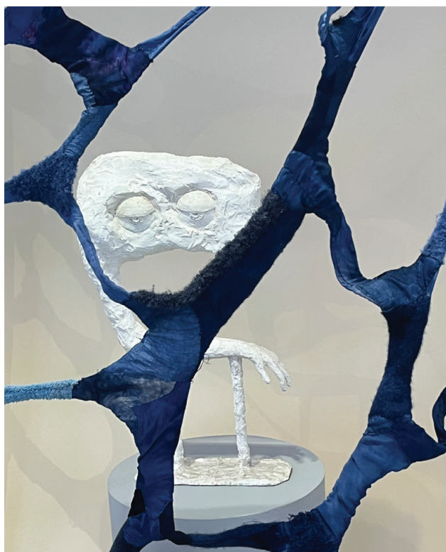
Karin Lundgren-Tallinger Textila verket: Drömmen om ett stort vattenhål (detalj) 2026, 250 x 170 cm, handsydd och handfärgad ull och silke Arne Widman Skulptur: Sleep, 2024, 62 x 30 x 15 cm, gips