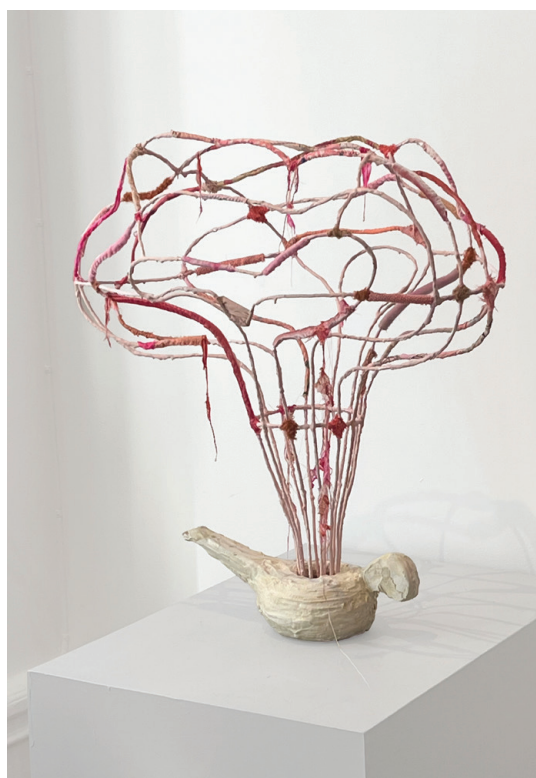
Karin Lundgren-Tallinger och Arne Widman Ali Baba med Aladdin och de fyrtio konstssamlarna 2026, 70 x 68 x 40 cm, gips, metall, textil