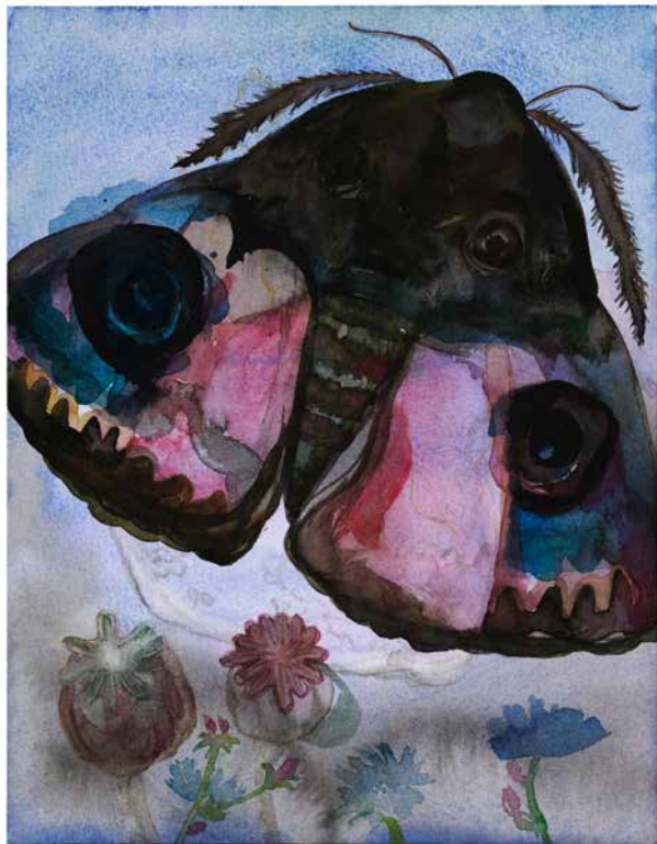
Utan titel, 2019, 31 x 23 cm akvarell på papper