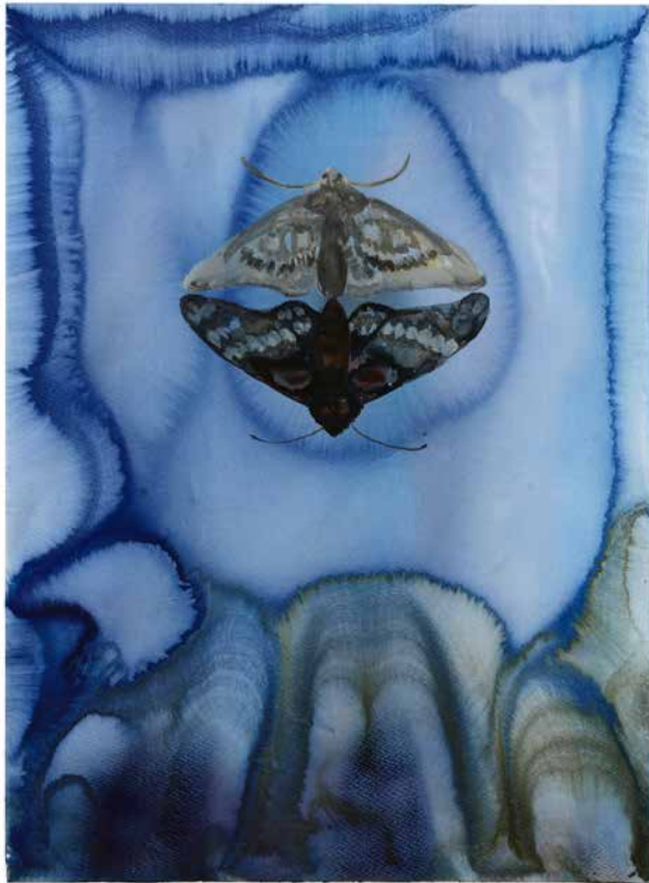
Utan titel, 2019, 76 x 57,5 cm akvarell på papper