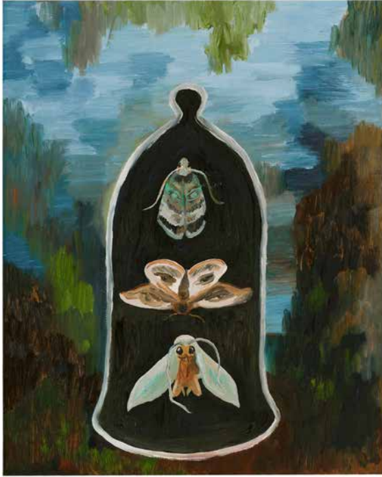
Utan titel, 2019, 35 x 28,5 cm, olja på duk